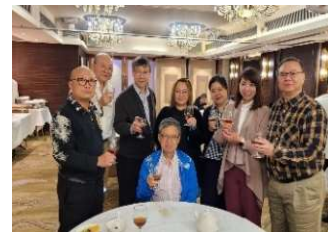
執事、同工及神學生

播道會得勝堂春茗 2020 及 2021 年，因新冠肺炎疫情肆虐及政府限聚令，得勝堂春茗未能以大型宴會方式進行。感謝神給我們智慧及應變能力，也為我們預備地方，今年嘗試改為以小型春茗進行，三月至四月期間共進行了 12 次小型春茗，總宴請人數約 200 人，每次都乎合政府限聚令。感謝神，因這改變使我們更能接近每一位來賓，更重要的是每位來賓都能專心聆聽福音。有出席春茗之來賓表示對福音有興趣，更邀請同工們相約晚飯，最終有兩位朋友決志相信耶穌，現跟進栽培中。教會門訓組員也有機會參與嘗試學習傳福音或分享見證。