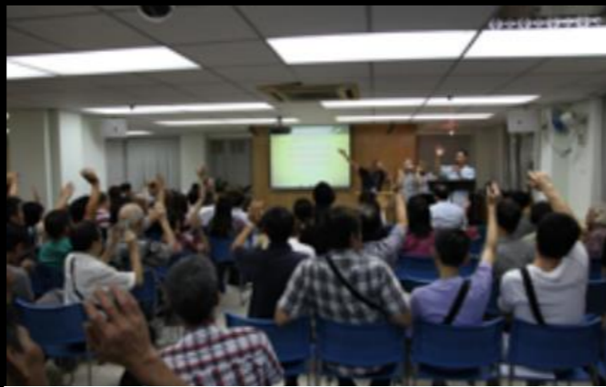
當年，一眾江湖兄弟參與得勝崇拜。

還有，在得勝堂的事奉，我進深學了上帝是信實的。看見福音的能力，真的可以改變江湖人的思想和行為。在經濟緊絀時，經歷上帝藉人提供的及時雨。經歷與教牧同工和信徒領袖的合作，簡直是奇妙！