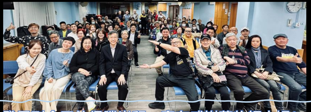
發展到今天的得勝崇拜，實在感謝莫牧師夫婦！