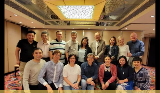
莫牧師、師母與得勝同工執事團隊...與信徒領袖及外展宣教士

綜合來說，二十多年的得勝事奉，是把我所有的神學和信念，進行了徹底的測試。上帝究竟是否可信？我經歷印證上帝是信實可靠的。只有感恩，讚美祂！