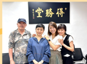
敬拜隊戰友兼好友