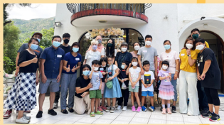
服事屯門英文班的家庭