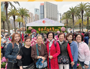
慧研雅集參觀花展

慧研雅集的姊妹為爭取多向準備退休的莫牧師學習，所以參加了“恩賜與事奉”和“傳福音的裝備與策略”，之後大家仍回歸慧研雅集姊妹組。平均出席約有13人。我常常很欣賞她們積極學習聖經，背金句更是一流！她們互勉互勵的團契精神更是我生命中的鼓勵。神藉福音性查經班也建立了不少慕道的朋友，他們因研讀耶穌事蹟對主更堅信不移，甚至準備年底接受洗禮。愛慕神的，抱著平安…願主賜福他們每一位。個人關懷牧養也是我常用的牧養方式，包括個別栽培姊妹上“茁苗”班、關心電聯、督責勉勵、探訪探病、陪伴覆診、視像禱告、戶外郊遊、茶聚。我只是不斷學習耶穌，祂走遍各城各鄉，接觸癲瘋病人、罪人妓女、患各種病者、社會中各階層人…聆聽他們，進入他們的生命和感覺中做見證，以真誠的愛心和尊重回應他們的需要。教導那些願意聆聽的人，並站在公義與憐憫的道路上，勉力前行。