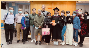
感謝大家祝賀我畢業