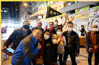
聖誕節廟街報佳音