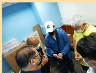
和哥、BB偉哥在查經後決志信主