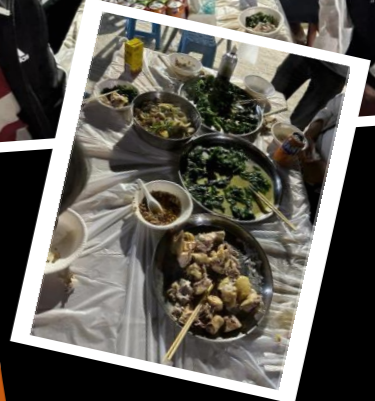
把握機會以禱告祝福江湖友好