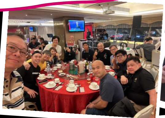
出席江湖友好們之壽宴

江湖友好飲宴陸續有來，得勝堂牧者繼續帶領領袖及信徒參與，盼望把握任何機會將福音帶給各江湖友好，祝福他們！