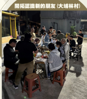
開拓認識新的朋友 (大埔林村)